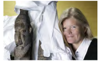
Fondation Martine Aublet