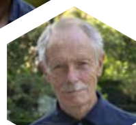
Erri De Luca