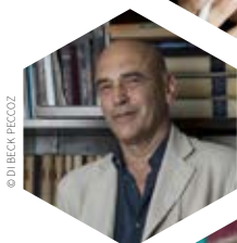
Bruno Guerri Giordano