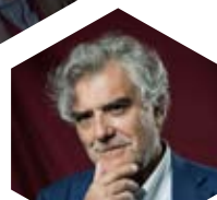
Giancarlo De Cataldo