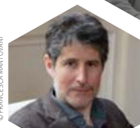
Giuliano Da Empoli