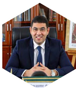
Mohammed Mehdi Bensaid

Puisse la lecture, ce miracle quotidien, nous réunir dans nos différences.